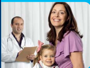
Liberty Saúde Seguro de Saúde