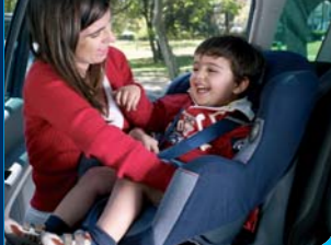
Liberty Auto Seguro Automóvel