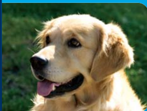
Liberty Pet Seguro de Responsabilidade Civil