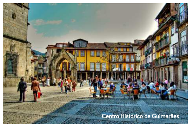
Centro Histórico de Guimarães

Após o café da manhã no Hotel, pelas 11h15 traslado a uma reputada Vinícola da região onde efectuaremos visita terminando com prova de vinhos . Traslado à Régua, almoço livre . Pelas 16:30 comparência na estação da Régua . Pelas 16h50 regresso em Trem com destino ao Porto , chegada prevista pelas 18h50 à Estação de São Bento que se afirmou-se como um dos principais monumentos na cidade do Porto sendo especialmente célebre pelos seus painéis de azulejos. Traslado ao Hotel Fenix Porto****, hospedagem, Jantar livre .