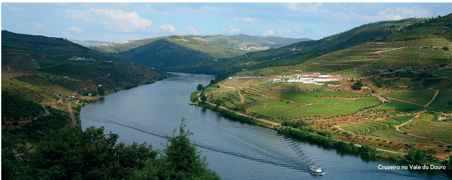
Cruzeiro no Vale do Douro