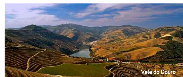
Vale do Douro