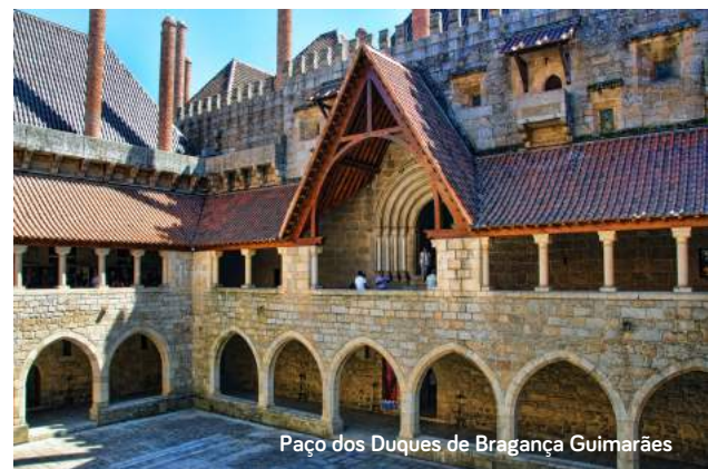
Paço dos Duques de Bragança Guimarães