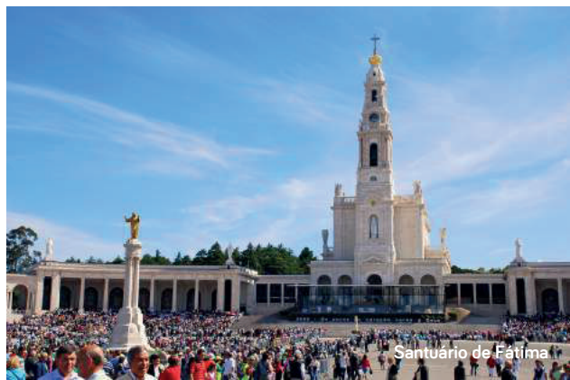
Santuário de Fátima

Não Inclui: Quaisquer serviços que não se encontrem devidamente mencionados no presente itinerário e extras de carácter pessoal (ex. telefonemas, bar, mini-bar, lavanderia, bagageiros, etc.) e ou taxas de turismo.