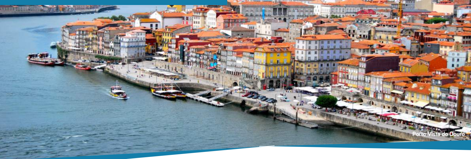
Porto Vista do Douro