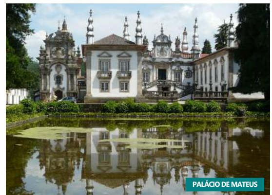
PALÁCIO DE MATEUS