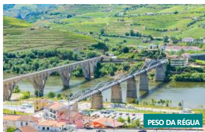
PESO DA RÉGUA