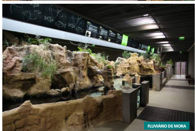
FLUVIÁRIO DE MORA

Após o pequeno Almoço visitamos a antiga Central de Compressores situado na mina de Algares seguindo depois para um dos símbolos de Aljustrel o Malacate Vipasca , um enorme elevador de ferro que transportava os mineiros até ao interior da mina. Seguimos para Castro Verde onde visitamos a Basílica Real e o Tesouro, Núcleo Museológico de Arte Sacra , onde se podem apreciar algumas das alfaias religiosas mais importantes do concelho. Seguimos para Almodôvar . Almoço . Após o Almoço breve visita à Igreja Matriz seguindo depois para Faro com paragem no Miradouro do Caldeirão , passando por Barranco Velho e São Brás de Alportel até Estói . Chegada a Faro , a capital do Algarve e ao marco 738 e fim da Estrada Nacional 2 . Jantar e Alojamento no Hotel Faro**** ou similar.