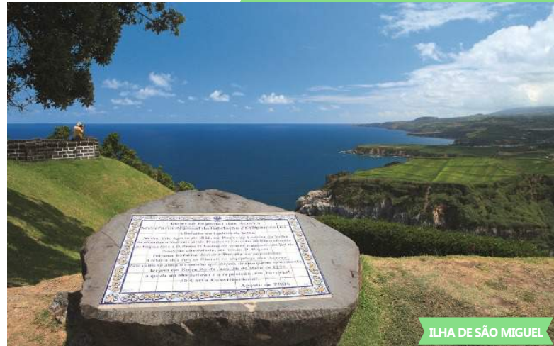
ILHA DE SÃO MIGUEL