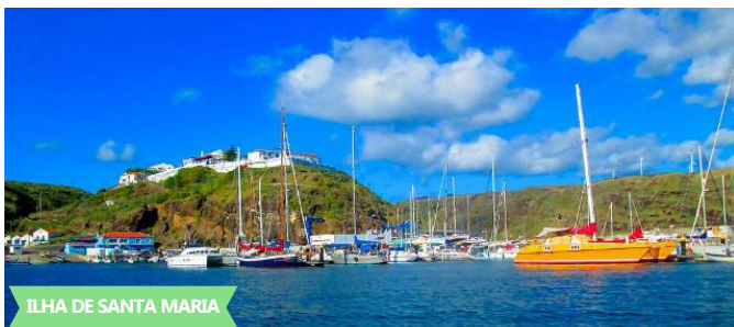
ILHA DE SANTA MARIA