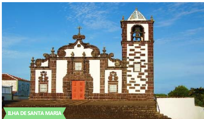
ILHA DE SANTA MARIA

Comparência no aeroporto duas horas antes da partida. Formalidades e partida em voo SATA com destino à ILHA DE SANTA MARIA , chegada, desembarque seguido de visita à ilha, iniciando pela Vila do Porto , com paragem no Forte de São Brás, Anjos (local de chegada dos Portugueses, onde mais tarde Cristovão Colombo viveu uma atribulada aventura). Continuamos para a Costa Norte até à aldeia presépio de Santa Bárbara , com casas típicas rurais marienses, em São Lourenço admiramos a sua impressionante paisagem vinhateira, paragem no Miradouro do Espigão. Santo Espírito (visita à Igreja Barroca), Maia (as vinhas, a cascata e a sua piscina natural), Praia Formosa (admirar a sua bonita baía de areias douradas), terminando no aeroporto. Partida em voo SATA para a ILHA DE SÃO MIGUEL . Chegada, desembarque e transporte ao hotel * * * / * * * * Jantar e alojamento.