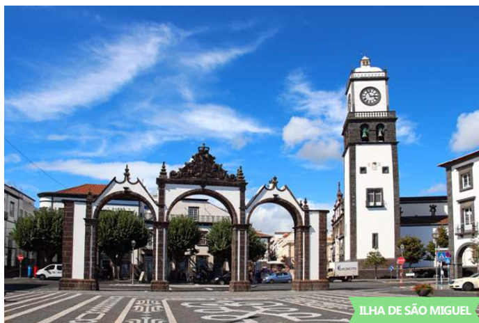
ILHA DE SÃO MIGUEL

Pequeno-almoço e saída para a visita ao maciço montanhoso das Sete Cidades , pelo Miradouro do Pico do Carvão , local privilegiado para se observar a formosa paisagem verdejante da zona mais estreita da Ilha e das suas costas. Miradouro da Vista do Rei , onde irá deslumbrar-se com a vista da cratera das Sete Cidades e das suas lindíssimas lagoas Azul e Verde. Descida para o interior da cratera, onde se irá maravilhar com a lagoa de Santiago , freguesia das Sete Cidades . Almoço . Durante a tarde, passeio pedonal pelo centro histórico da cidade de Ponta Delgada , admirando exteriormente o Palácio da Conceição (Presidência Governo Regional Açores), entrada no Mercado, Portas do Mar e Marina, Portas da Cidade, Igreja Matriz de São Sebastião , no Campo de São Francisco entrada no Museu do Convento da Esperança . Jantar e alojamento.