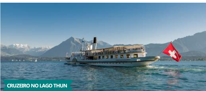
CRUZEIRO NO LAGO THUN

- Em hora a indicar, saímos para um restaurante típico, onde tem lugar o jantar com exibição de Folclore! Regresso ao hotel. Alojamento.