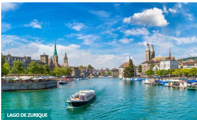
LAGO DE ZURIQUE

Após o pequeno-almoço, deixamos o hotel para nos dirigirmos a LUCERNA . Nas margens do Lago dos Quatro Cantões, rodeadas de verdejantes montanhas, é uma cidade de grande beleza. O nosso guia orienta passelo a pé pelo pitoresco centro histórico , admirando a Ponte da Capela (ícone da cidade), Igreja dos Jesuítas , Praça do Mercado e a Câmara Municipal . Continuação para STANS , uma pitoresca cidade localizada entre o Lago Lucerna e as Montanhas. Almoço . Depois, vamos a bordo de um antigo FUNICULAR DE MADEIRA , para realizar um agradável passeio através de prados floridos, seguido de ingresso em TELEFÉRICO ABERTO (o 1º no Mundo), onde realizamos um deslumbrante passeio subindo à Montanha de Stanserhorn . Cenário indescritível, paragem para fotos. Terminado o passeio, prosseguimos para INTERLAKEN . Localizada na Suíça central, entre os maravilhosos Lago de Thun e o Lago de Brienz é uma cidade apaixonante, que oferece paisagens de sonho. Check-in Jantar e alojamento em quarto standard no hotel Artos * * * sup. ou similar