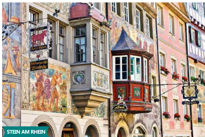
STEIN AM RHEIN

Viagem organizada por Tourland Portugal Operador de Turismo Lda. RNAVT 3864 www.tourlandportugal.com / geral@tourlandportugal.com