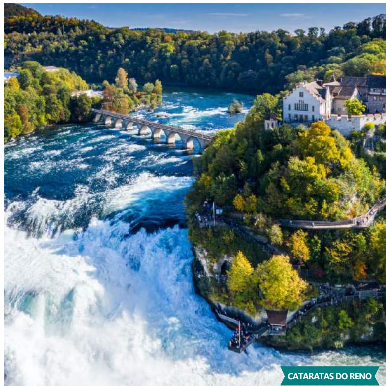
CATARATAS DO RENO

Saída após o pequeno-almoço, para excursão até SCHAFFHAUSEN , onde o nosso guia orienta passoio a pé pela cidade velha de ricas casas decoradas com janelas de vidro e as fachadas pintadas , e ao centro admiramos a imponente fortaleza de Munot . Deixamos a cidade e percorrendo cerca de 4km chegamos a RHEINFALLS (Cataratas do Reno) a atração turística mais visitada da Suíça . Enormes massas de água caem nas rochas ao longo de uma largura de 150m. Entrada no parque incluído, onde pode percorrer os vários miradouros e o elevador panorâmico . Após a visita, partimos para STEIN AM RHEIN . Almoço no percurso. O nosso guia orienta passoio pedonal pelo encantador centro histórico desta charmosa cidade à beira do Reno , formado por casas medievais de enxaimel com as fachadas pintadas, que lhe dá um ar colorido e especial, tornando-a uma das mais belas cidades . Terminada a visita regressamos ao hotel. Jantar e alojamento.